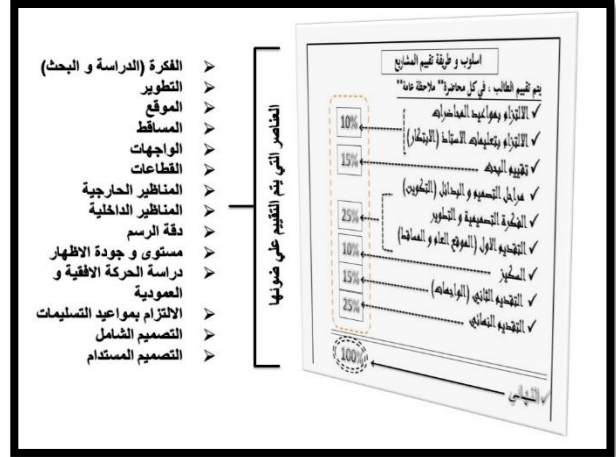
جدول رقم (2)

وهو جدول استكمالا للجدول رقم (1) يوضح تفصيل ما سيتم التقييم من اجله و هذه العناصر الحسية و المادية تكون مسيطرة علي تفكير المقيم طيلة فترة التقييم مع ارتباطها بشخصية الطالب في ذهنه